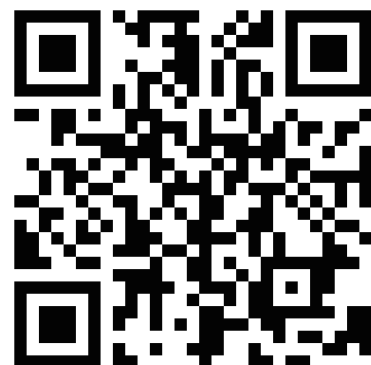
新規登録 QR コード